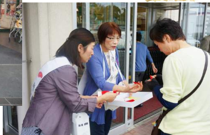
(写真は昨年の様子です)

今年も10月1日から赤い羽根の共同募金が始まります。この募金は、「自分の町をよくする仕組み」をスローガンに運動しています。