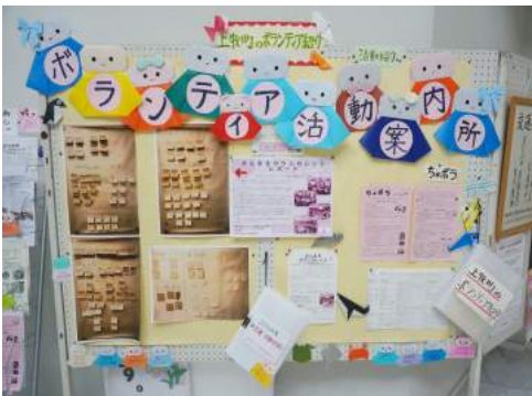
(季節の折り紙：てあそび club)

「ボランティアを始めようかな」「新しい活動をしてみようかな」と考えておられる方に気軽に情報を得ていただけるよう今後も発信を続けていきますので、2000年会館に来られた際はぜひご覧ください。