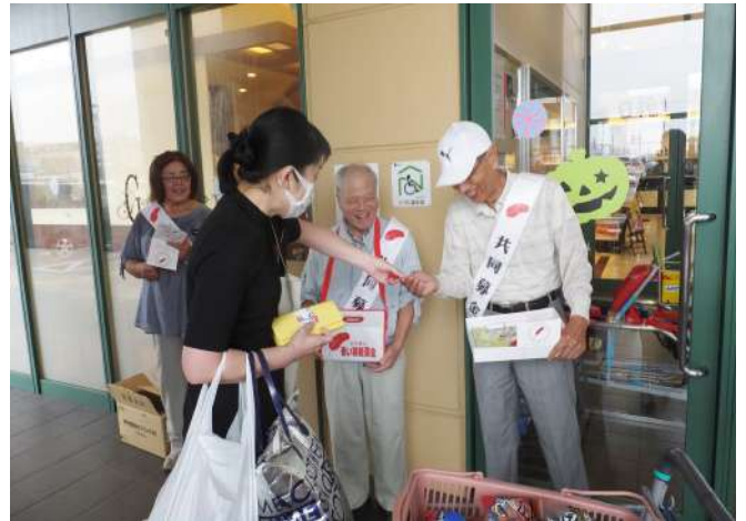
写真は昨年の様子です。