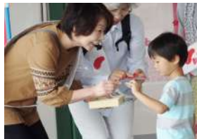
(今年度のおくやま・アピタでの街頭募金の様子です)