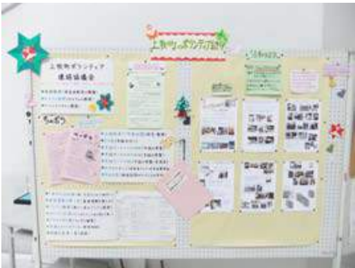
■写真は十二月のパネルです ■飾り作成：てあそび club