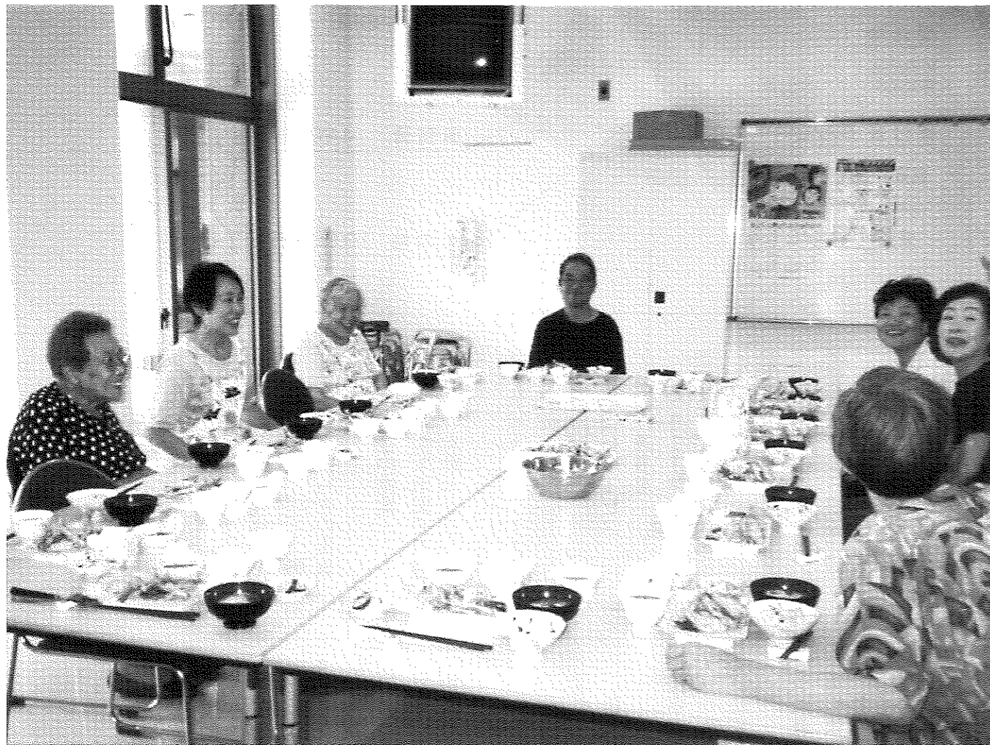
サロンで楽しい昼食 (ふくふくの会)

発行者 上牧町社会福祉協議会 〒639-0214 上牧町上牧 3245-1 (上牧町保健福祉センター内) TEL 0745-76-6098