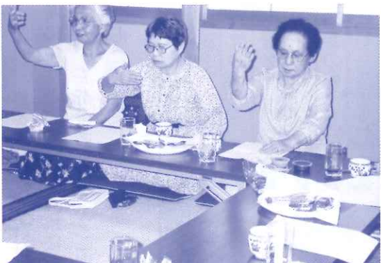
▲手話練習応用の指運動

ボランティア有志会は創立以来一二年、地区住民の福祉に軸足をのけた活動をしています。寝たきり防止、ひきこもり症候群の防止、老人性痴呆症の防止対策として、納涼大会・菊展・地区の文化祭など地域の催しに積極的に参加して貰うよう外出の介助をしたり、四季のう