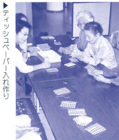
▶ ティッシュペーパー入れ作り