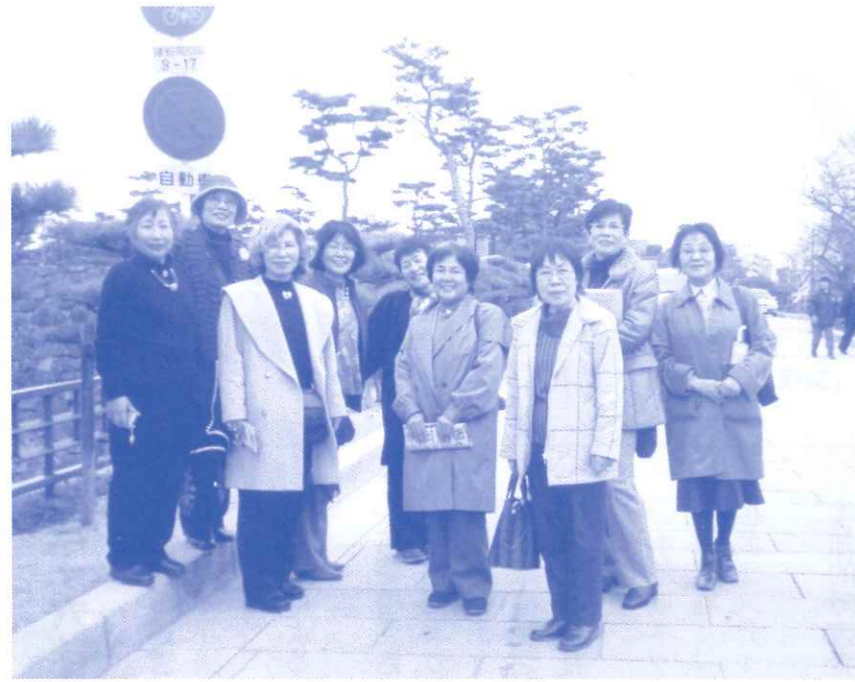
写真は、上牧町ボランティア連絡会の 県外研修の様子。 施設見学後、大 阪府岸和田市にて。 (2005.3.15)

発行者 上牧町社会福祉協議会 〒639-0214 上牧町上牧3245-1 (上牧町保健福祉センター内) TEL 0745-76-6098 FAX 0745-79-2021